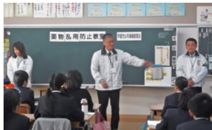
▲学校で薬物乱用教室を開催