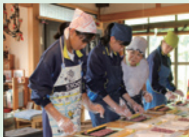
▲受入家庭で巻き寿司作りに挑戦する生徒

*特別なことをするのはなく、田舎での暮らしを体験し、交流することがこの事業の目的です。 興味をお持ちの方は、左記まで、どうぞお気軽にお問い合わせください。