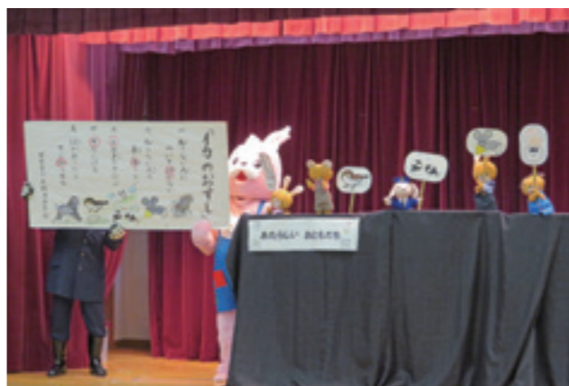
▲誘拐防止教室での啓発劇