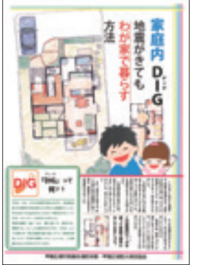
▲家庭内DIGリーフレット

“家庭内DIG”とは、大規模地震が起きた時、自宅で命を落とさない・ケガをしないようにするためにどのような準備をしておけば良いか、などをテーマとして、家族と話し合いながら自宅の平面図に危険箇所などを書き込み、家族みんなで地震時の対応策や地震発生後の生活について考えてもらうことを目的とした図上訓練です。