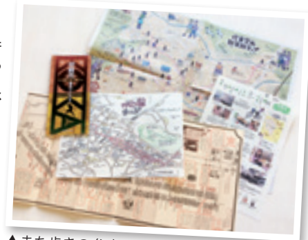
▲まち歩き参考になる市内観光マップ

イイネで気づく 街の魅力があるのかも 市内にはたくさんの観光資源がありますが、そうでなくても街や人の朝の風景、消えゆく景色などそこに住んでいる人ならではの写真が撮れるはず。撮った写真はよく観察して愛着を深めてください。対象をじっくり見ることが、新しい発見や見過ごしていた魅力・価値に気づく機会になります。そして、ぜひブログやSNSに投稿してください。訓練は必要かもしれませんが、そうやって撮った写真はプロが撮った観光写真とは違った魅力があるはず。