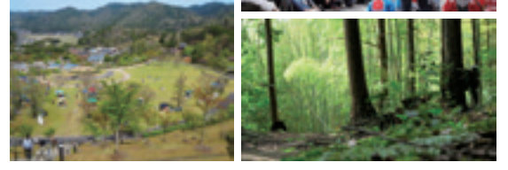
▲上から水口神社の祭、水口・宇川もやがかかる山々、ミホミュージアムのトンネル、水口・大池寺の雪、水口・南林口の夕景、水口・宇田の水田、水口・柏木神社の森、甲賀・大原市場商店街、水口囃子、陶芸の森の俯瞰、水口・名坂風致公園

参考1：ローカルフォトアカデミーに参加してきました。 http://kokaindex.sub.jp/archives/643 facebookグループ 甲賀まち歩きカメラ写真部 https://www.facebook.com/groups/kokamachicamera/ 地元で撮る、楽しむ、発信する 甲賀でまち歩き写真(記事の補足) http://kokaindex.sub.jp/archives/2061