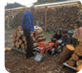
▲薪割り体験をする親子

中山間地域で山に囲まれていても、山や木のことを知っている子どもは少ないです。薪割り体験や木の皮剥ぎ、間伐体験、竹皿でカレーを食べるなどの体験とおして木の良さや香りを子どもたちに体感できる取り組みを行っています。