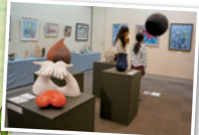
▲多彩な作品が並ぶ会場

第13回甲賀市美術展覧会が2月24日から3月4日まで、あいこうか市民ホールと碧水ホールで開催され、平面、工芸・立体、書、写真の4部門に応募があった295点の力作が並びました。3日に催されたウエルカム・ロビーコンサートでは、バイオリンの合奏で、おなじみの日本の歌などが演奏され、来場者は、芸術を身近に楽しむ機会となりました。各部門の甲賀市展賞受賞者は、次の皆さんです。(敬称略)