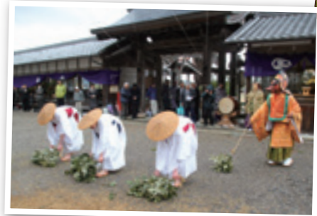
▲田植えの様子を表現する子どもたち

五穀豊穡を祈願するお田植え祭りが3月21日、甲南町池田の檜尾神社で執り行われました。この祭りは、田植えのまね事を演じ、イネの順調な生育を祈る農耕行事で、市の無形民俗文化財に指定されています。境内では、天狗の面をつけた役の指示に従い、すげ笠をかぶった3人の子どもが、苗代の苗取り作業や田植えの様子を表現しました。祭りに集まった地域の方は、「春が、そして田植えの時期がくるんだな」と伝統行事を見ることで、春の訪れを感じていました。