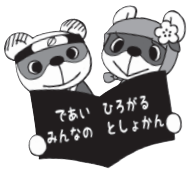
図書館キャラクターたぬ吉・パン子