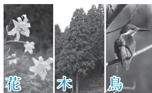
花 ササユリ 木 スギ 鳥 カワセミ