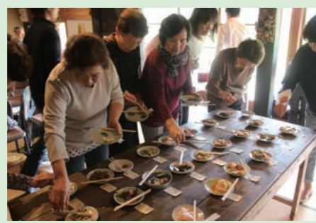
▲協働事業で空き家を活用している様子

■ 場所 / 水口社会福祉センター 福祉ホール ■ 内容 / 市民団体と市との協働事業および健康寿命を延ばそうモデル事業の取り組みの発表 ※ 申込不要