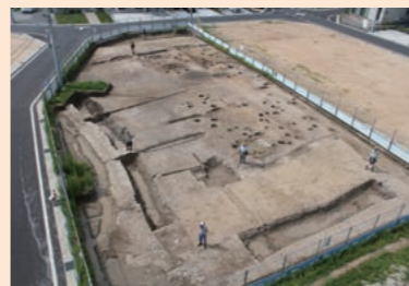
▲鎌倉時代から室町時代の方形居館

なお、貴生川遺跡の発掘調査成果については、平成28年・29年度に刊行された発掘調査報告書に詳細に記載されています。市内の図書館に収められていますので、ぜひともご覧ください。