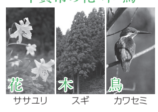
花 ササユリ 木 スギ 鳥 カワセミ