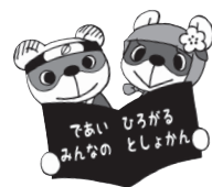
図書館キャラクター ため吉・ポン子