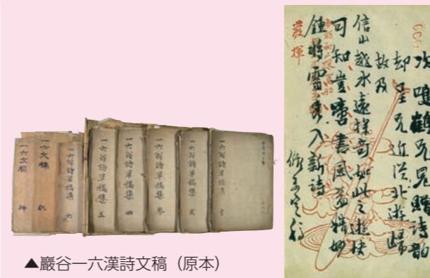
▲巖谷一六漢詩文稿 (原本)