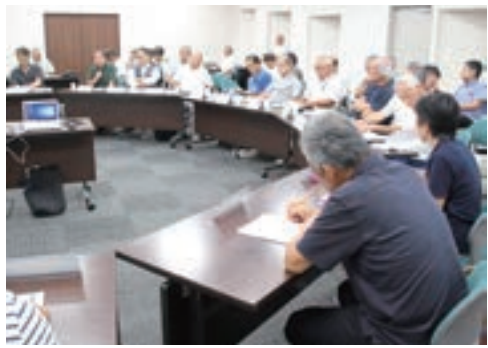
▲防災円卓会議の様子

家の間取り図を見ながら、家の中や周辺の危険を洗い出したり、避難経路を考えるなど、災害時の対応策を考える訓練です。