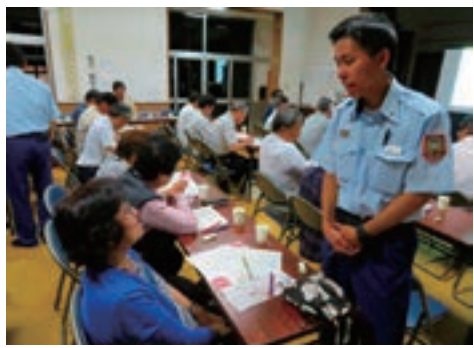
▲家庭内DIGに取り組む櫛野区の皆さん