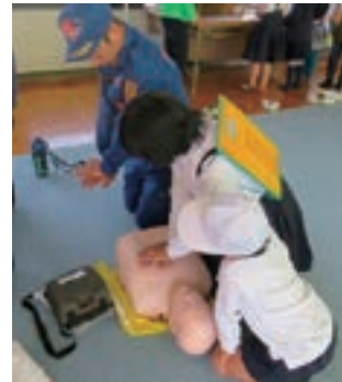
▲消防団員による心肺蘇生訓練