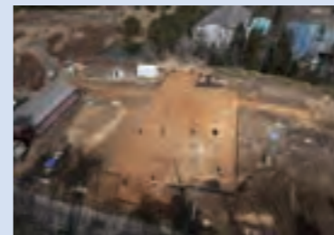
▲発掘調査で見つかった大型建物跡