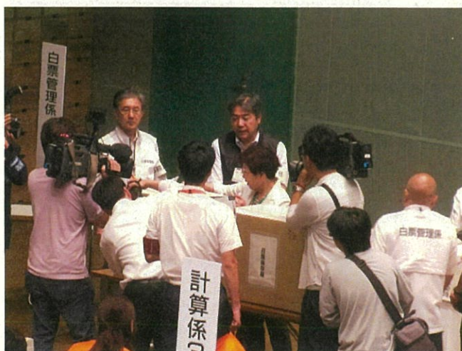
▲ 白票保存箱を封印する様子