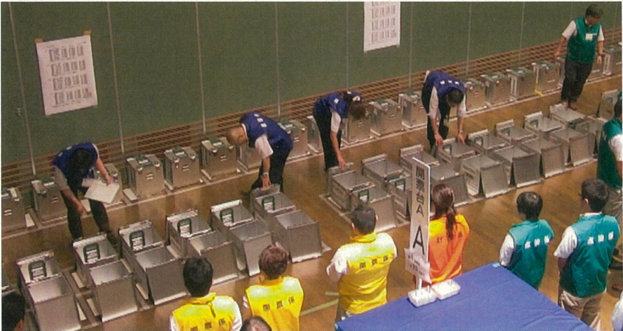
▲ 開披を終えた投票箱が空であるか確認する様子