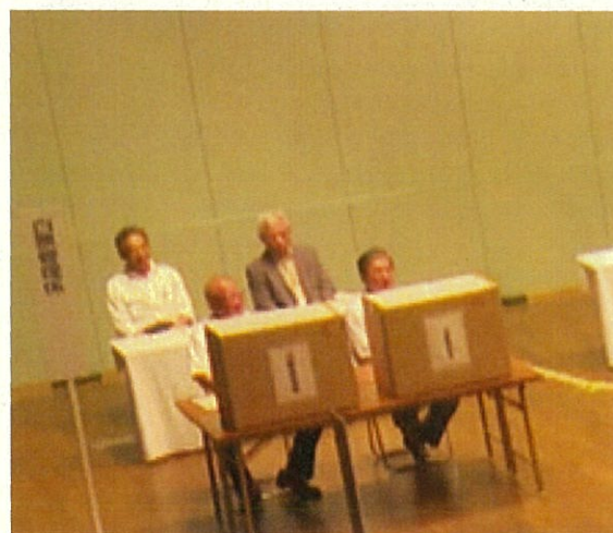
▲ 白票保存箱を監視する様子