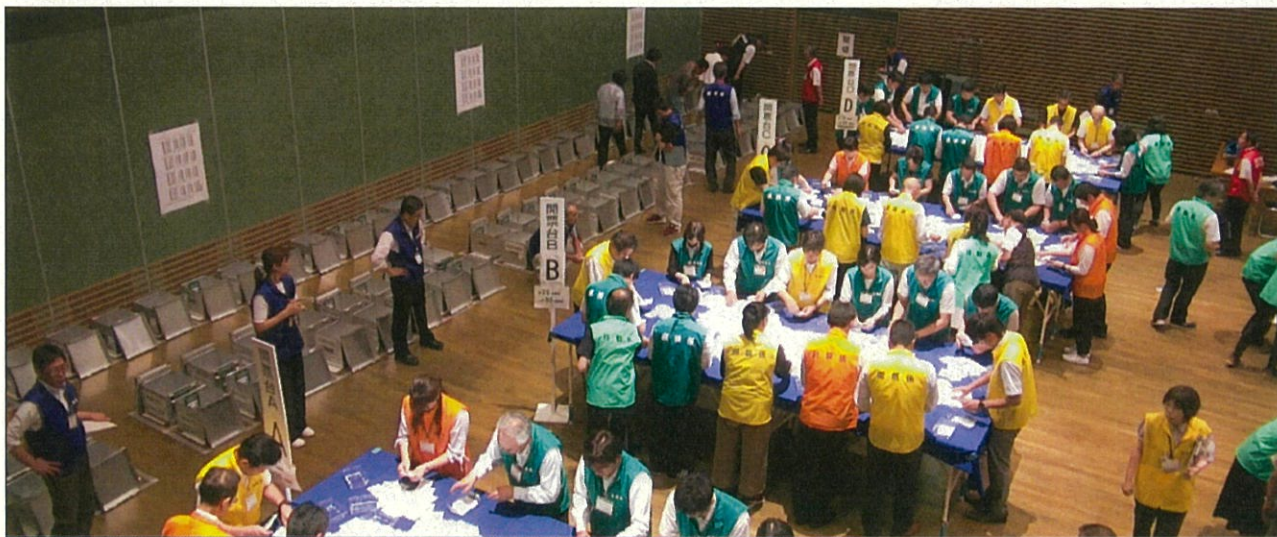
▲ 票を収集をする様子（開始直後）