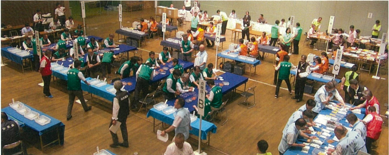
▲ 票の点検や審査を行う様子