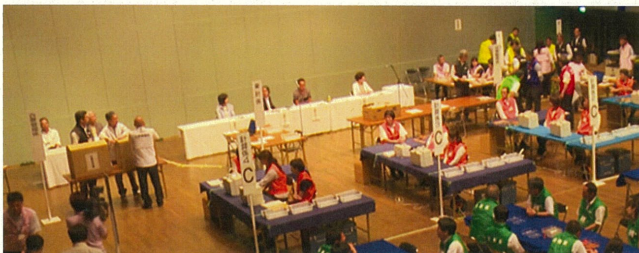
▲ 白票保存箱をテープで留める様子