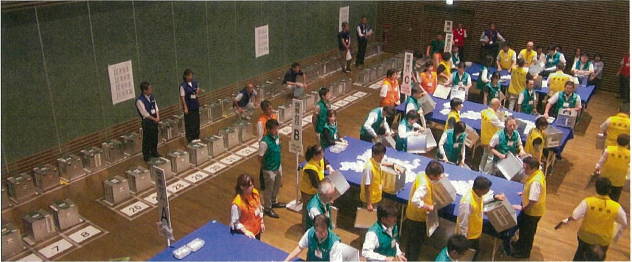
▲ 投票箱から票を取り出す様子