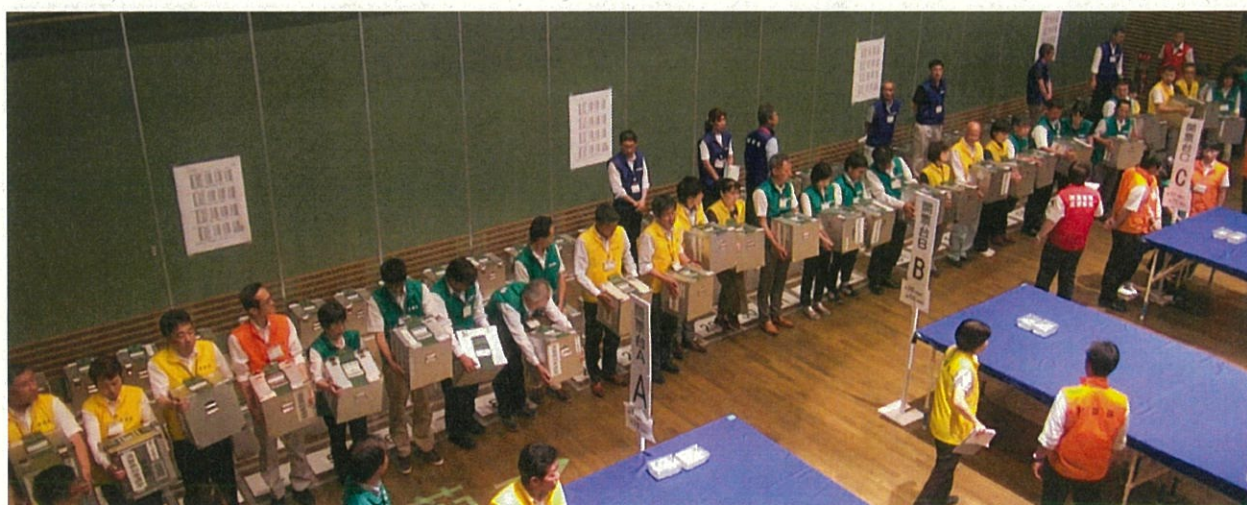
▲ 投票箱を開けるため整列する様子