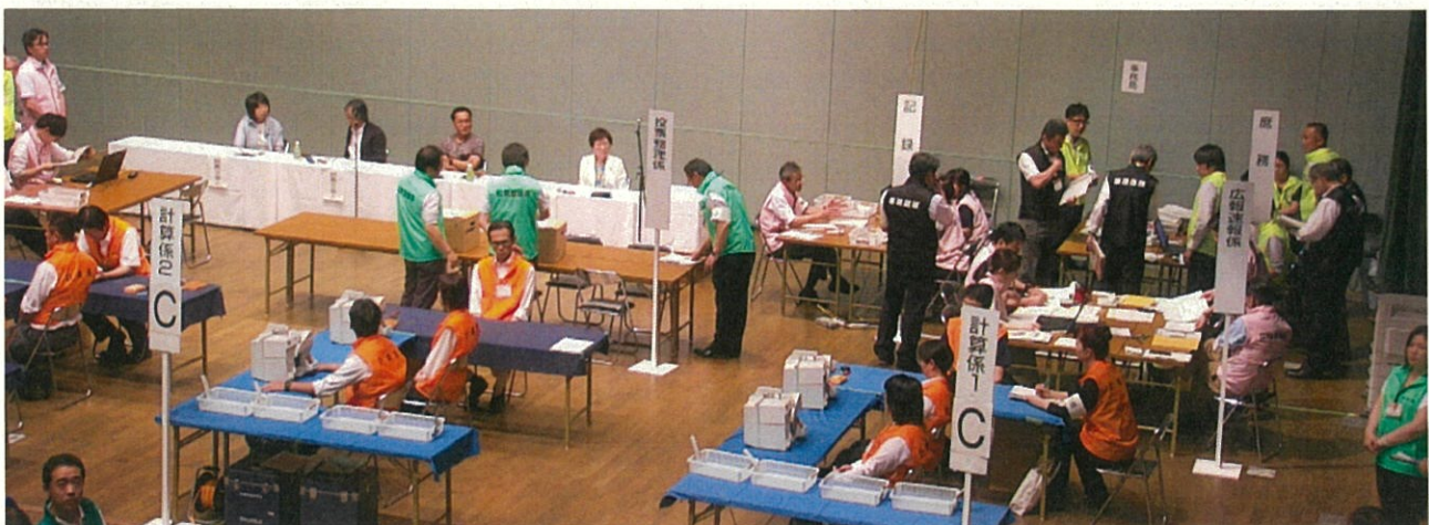
▲ 開票録を作成する様子