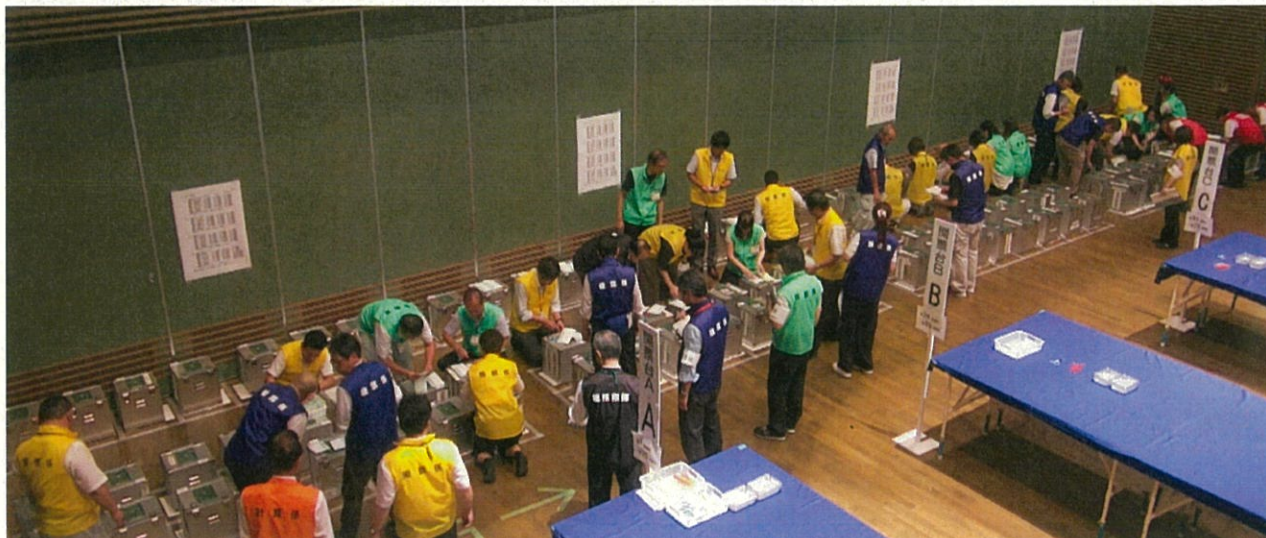
▲ 投票箱の開錠とその確認を行う様子