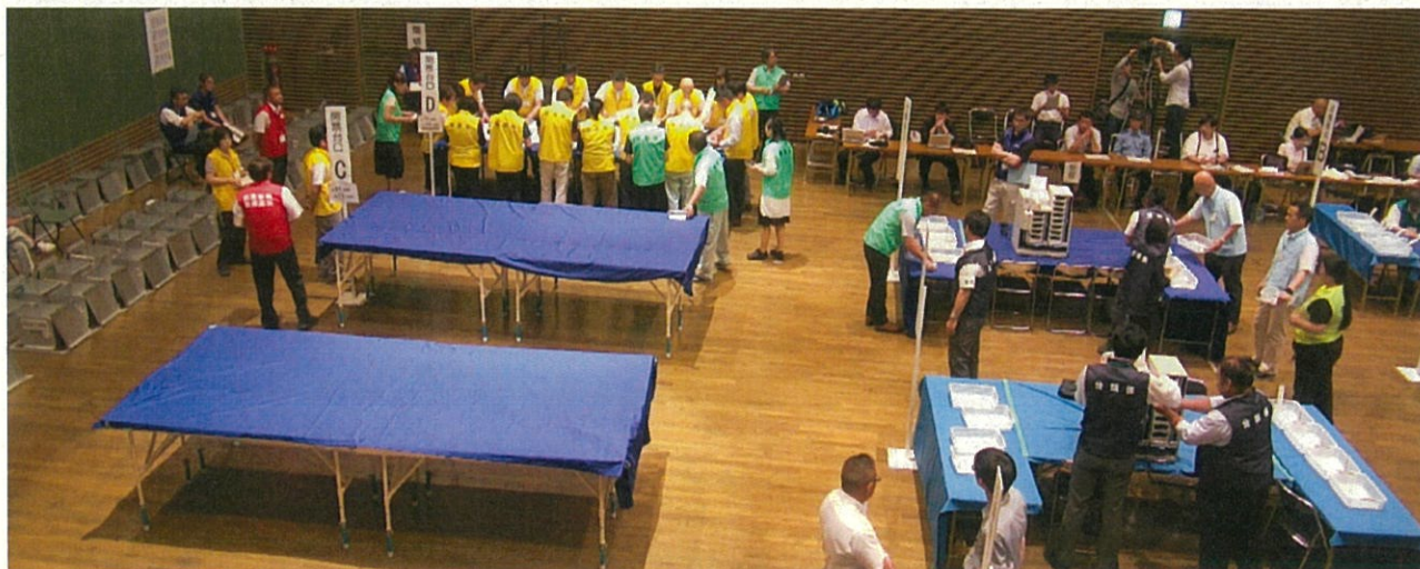
▲ 票の収集をする様子（終盤）