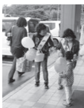
▲歳末たすけあい募金活動

民生委員・児童委員、主任児童委員には守秘義務があり、相談した方の秘密は守られますので、お気軽にご相談ください。 今月の主な活動としては、歳末応援金・応援品の配布があります。これは、新しい年を迎える時期に支援を必要とする方々が、住み慣れたまちで安心して暮らすことができるよう、地域の皆さんから寄せいただいた共同募金の歳末たすけあい募金配分金を活用したものです。ご協力ありがとうございます。