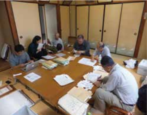
▲目録作成に没頭する宇田郷土史会のメンバー

現在、宇田郷土史会では、年寄講についての調査を進めておられます。この会は、宇田に住む有志のメンバーで構成されており、年寄講に関する記録の目録作成など、地道な活動を続けています。