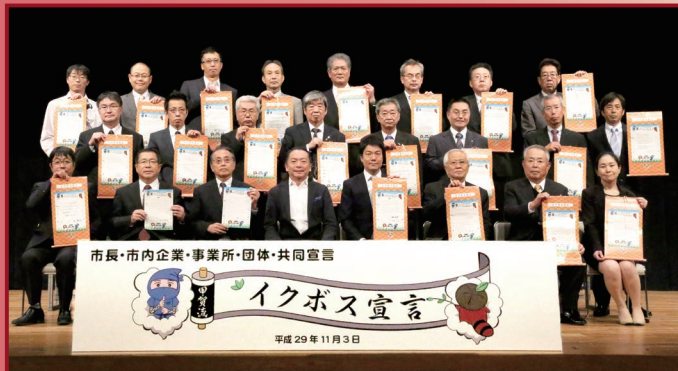
▲昨年度のイクボス共同宣言式

働き方改革に積極的に取り組んでいる企業等の「事例発表」や「トークセッション」を交えた事業報告会と今年度イクボス宣言された企業等の「イクボス宣言式」を開催します。