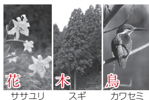
花 ササユリ 木 スギ 鳥 カワセミ

あふれる愛に いろいろな山と川と こぼれる笑顔に うみだす活力 かがやく未来に あなただけ仲間 生きいき文化 応える安心 受けつぐ伝統 鹿深の夢を