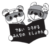
図書館キャラクターたぬ吉・ポン子