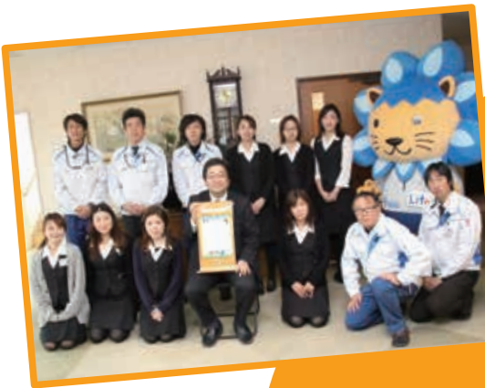
▲甲賀協同ガス株式会社の皆さんとマスコットキャラクターのらいふくん

職場で共に働く部下の仕事と生活の調和(ワーク・ライフ・バランス)を応援しながら、組織の業績も結果を出しつつ、自らも仕事と私生活を充実させている上司のことです。