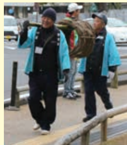
▲つるを担いで東大寺二月堂へ奉納する講員ら

毎年、1月上旬から1カ月程かけて、つるを採取しています。葛づるといふ種類のもので、その量は重さにして約400kgにもものぼります。建国記念日である2月11日に、一部のつるを担いで東大寺二月堂まで、奈良街道約3キロの道のりを歩いて奉納します。