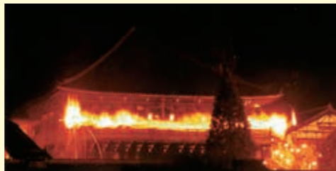
▲東大寺二月堂のお水取り

お水取りで使われる松明の材料は、全国各地の「講」が分担して奉納していますが、松明を縛る「つる」を奉納するのは私たち、江州一心講だけであり、歴史も大変長いです。先人から続いている伝統をこれからも引き継いでいきたいという思いで活動しています。お手伝いしていただける方やつるの生息地の情報などをいただくとありがたいです。