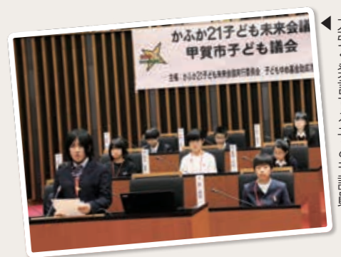
力強く発言する子ども議員

かふか21子ども未来会議による「甲賀市子ども議会」が1月26日、市役所内の議場で開かれました。子ども議会は、昨年6月に市長から任命を受けた小学5年生から中学3年生までの子ども議員が、市内の視察や研修を通して学んだことを集約し、子どもの視点から市政に対して提案・提言を行うものです。