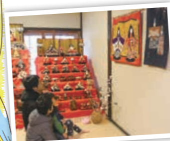
▲おひなさまの描かれたタペストリーを眺める来場者

この催しでは、地域の宝である子どもたちの無事な成長や幸せを願い、市内の家庭から譲り受けたひな人形を展示しています。また今回は、大阪北部地震の影響で土山町に転居して来られた方の手作りのタペストリーも飾られています。