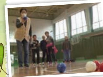
◀ボッチャに挑戦する参加者

ボッチャは、目標となる白いボールに自チームのボールをいかに近づけるかを競う競技で、参加者は講師からボールの投げ方を教わった後、赤と青の2チームに分かれ、白熱した戦いを繰り広げました。