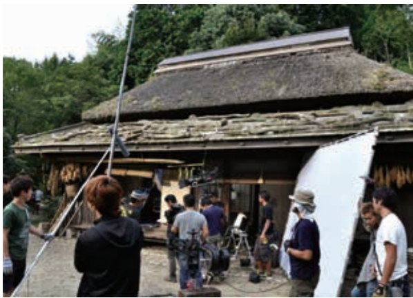
▲過去に映画ロケで使用したみなくち子どもの森の古民家