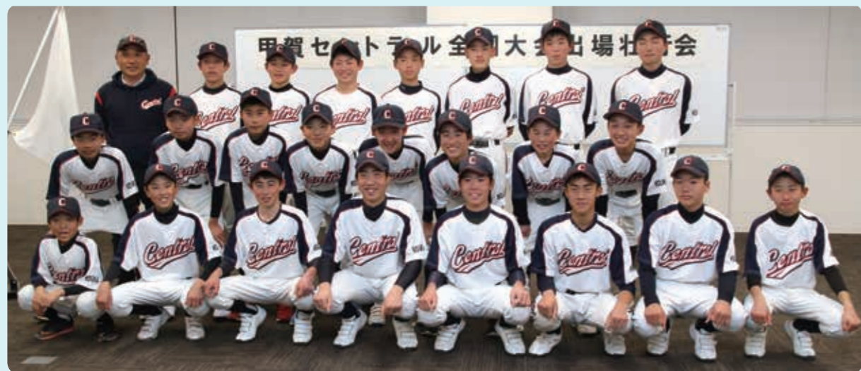
▲甲賀セントラルの皆さん