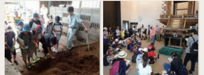
▲市内視察で話を聞く子ども議員

子ども議員の皆さんが今回の経験を生かし、今後学校や地域で活躍されることが期待されます。