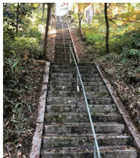
▲愛宕神社への階段