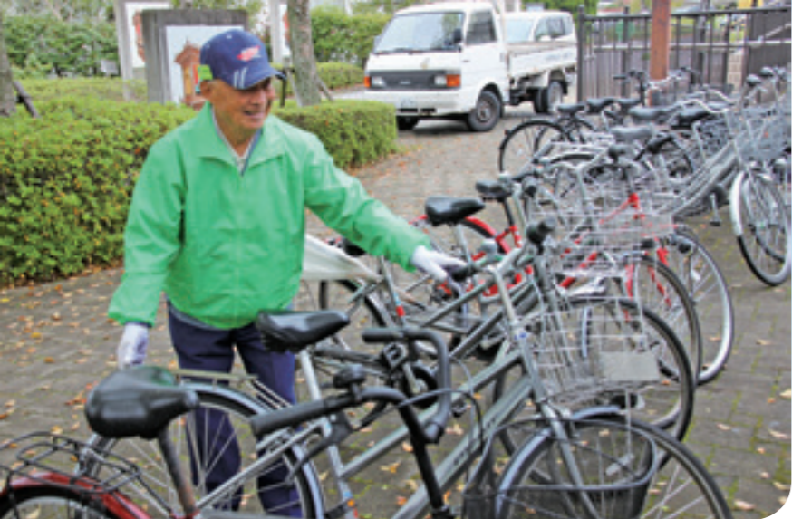
▲駅前の駐輪場での自転車整理

現在、一人暮らしをされておられますが、食事は、小さい頃に母親を亡くした経験から、自炊することもあまり苦にならないという