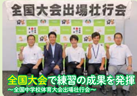
全国大会で練習の成果を発揮 ～全国中学校体育大会出場壮行会～

日時 10月5日(土) 9時30分～15時(小雨決行) 場所 石水溪キャンプ場施設周辺 (三重県亀山市安坂山町1178-3) アクセス 名阪国道「亀山IC」から車で約20分 ※参加費無料・申込不要 ※宝探し・マスつかみは、当日現地でお申し込みください(先着200人) 問合せ 石水溪まつり実行委員会 亀山市文化会館内 ☎0595-82-7111