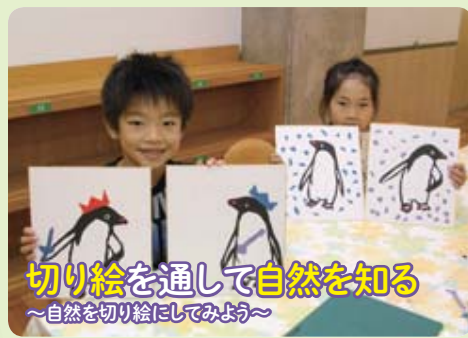
切り絵を通して自然を知る ～自然を切り絵にしてみよう～