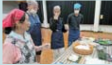
▲地域の方に教わり巻き寿司作り挑戦するベルギーの方

陶器店や茶畑巡りのほか、地域の方たちと巻き寿司作りやバーベキュー体験をしたり、地域のスーパーへ買い物出しに行ったりしてもらいました。宿泊については試行的に公民館での寝泊り、お風呂は民家の風呂を借りる「もらい湯」で対応しました。来られる前は「楽しんでもらえるかな」と不安でしたが、私たちにとって当たり前の日常が、ベルギーの方にとってはおもしろいようで、予想以上に楽しんでもらうことができました。