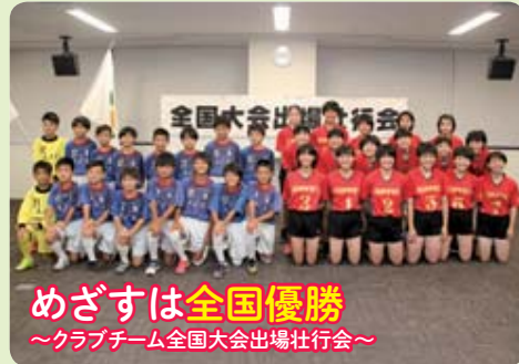
めざすは全国優勝 ～クラブチーム全国大会出場壮行会～