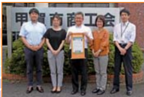
▲甲賀市商工会のみなさん

職場で共に働く部下の仕事と生活の調和(ワーク・ライフ・バランス)を応援しながら、組織の業績も結果を出しつつ、自らも仕事と私生活を充実させている上司のことです。