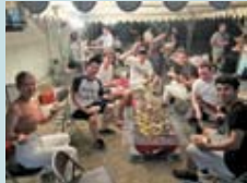
▲バーベキューの様子

研究会メンバーである県内の旅行業者のもとに、ベルギーの旅行業者から「変わった体験ができるこれまでにない観光を」と要望があったのがきっかけです。お迎えにあたり、4月から7回開催した「外国人とのコミュニケーション講座」には、子どもからお年寄りまで幅広い年齢層の方に参加していただき、簡単な英会話や外国人とのコミュニケーションの姿勢などを学んで準備しました。