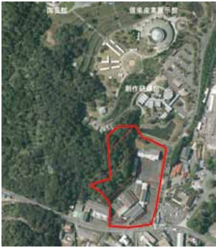
今回取得予定の信楽・陶芸の森前私有地