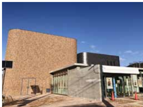
オープンが待ち遠しい信楽伝統産業会館