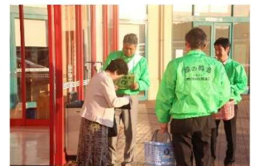
緑の募金活動(全国植樹祭のPR)アルプラザ水口・フレンドマート甲南