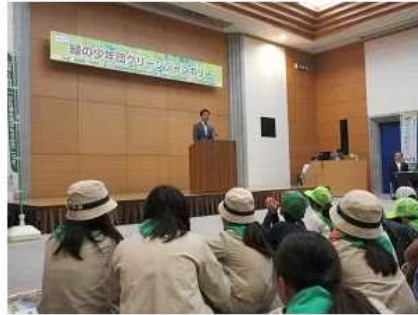
2019年10月27日 鹿深夢の森でグリーンジャンボリー開催

本市で新たに誕生した、大原・油日・佐山緑の少年団などを含めた10団、総勢約200名が参加した。大野緑の少年団などの活動発表の後、樹木観察やネイチャーゲーム、木製プランターカバーづくり等が行われた。