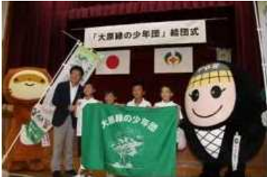
2019年9月18日 大原緑の少年団 結団式