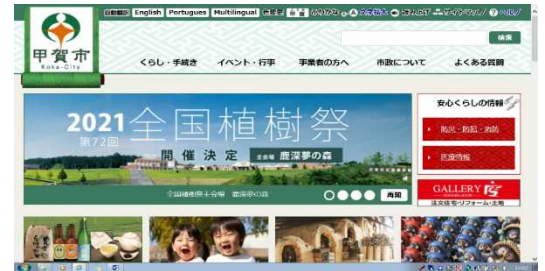
甲賀市ホームページ