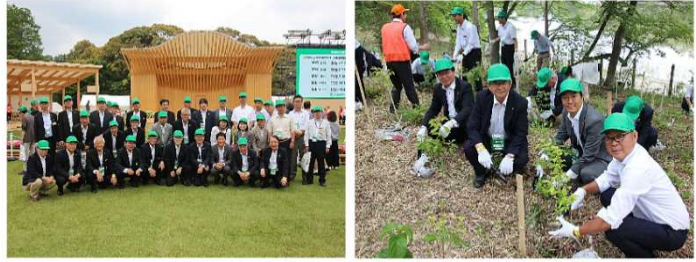
【第70回全国植樹祭（愛知県森林公園）】