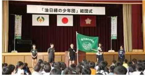
2019年10月1日 油日緑の少年団 結団式