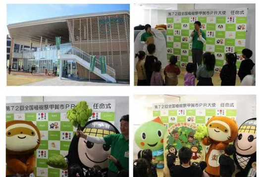
2019年12月1日 第72回全国植樹祭甲賀市PR大使任命式

・「にんじゃえもん」、「ぼんぼちゃん」をPR大使に任命<令和元年12月1日(日) /甲賀市まちづくり活動センター「まるーむ」>