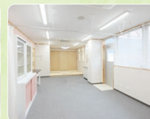
園児が安心して医療的ケアが受けられる「ケアルーム」