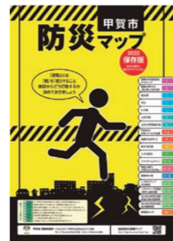
◀甲賀市防災マップ 2022保存版