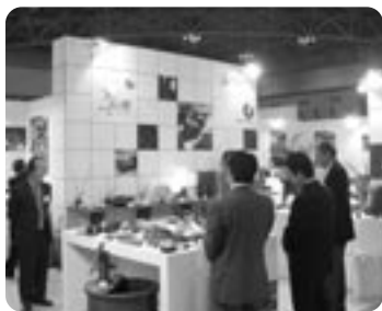
21世紀信楽と題して

”信楽焼”という名称を世界に発信する良い機会となり、参加された方も世界各国のそれぞれの伝統に感動された様子でした。