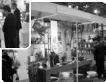
信楽焼を世界に発信