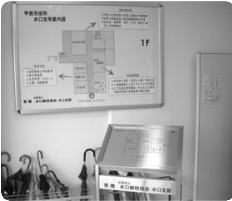
スタンド式には点字案内も

この度「社団法人 水口納税協会 水口支部」が水口支所玄関に入口案内図とスタンド式点字案内板を寄贈いただきました。案内図には支所にある総合窓口課、地域振興課、教育分室の場所と事務内容が記載され、ひと目でわかるようになっていきます。また、スタンド式の案内板には点字案内もあり、目の不自由な方へも配慮したバリアフリー対応となっています。今後も寄贈いただきました案内板を活用し、来られた方にわかりやすい市役所をめざします。ごつもありがとうございました。