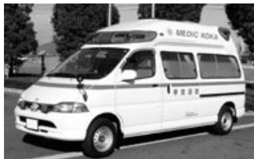
最新鋭の機器を装備した救急自動車