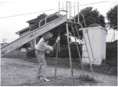
青少年活動施設一斉安全点検

子どもたちが安心して、楽しい夏休みを過ごせるよう、市内のキャンプ場や公園などの施設の一斉安全点検を実施します。対象となる施設は、市内に292あり、それぞれ管理を行う担当課の職員が遊具の破損や施設の老朽化による危険箇所を調べ、修理などの対策を講じます。