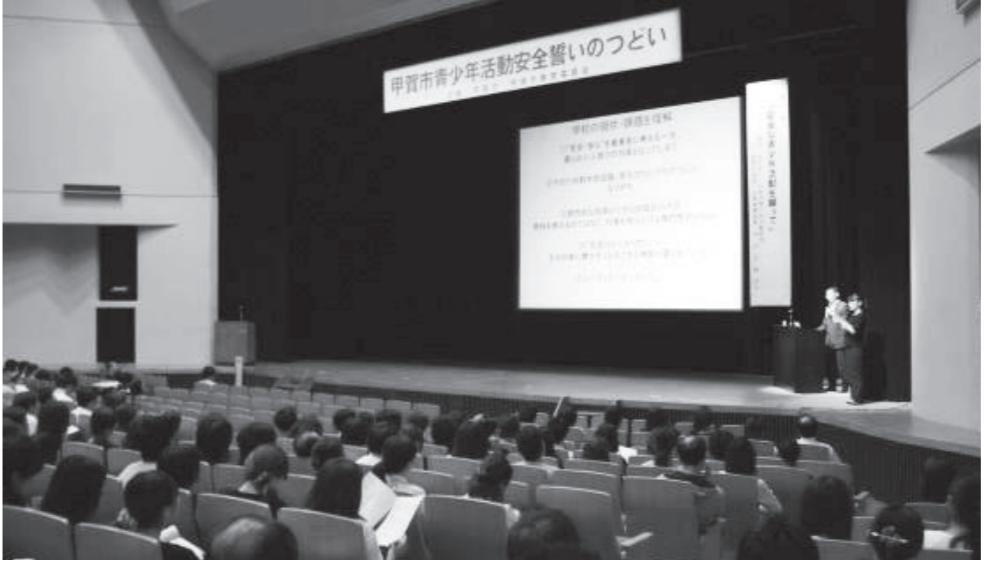
昨年の「甲賀市青少年活動安全誓いの日」より

平成19年7月31日、市教育委員会が実施しました高知県四万十川での野外体験講座において、市内の小学生お二人の尊い生命を奪う重大な事故を起こしました。市と市教育委員会では、このような重大事故を二度と起こさないよう、また事故を忘れることなく教訓としながら、子どもたちの成長にとって大切な青少年活動を、安全に実施していくために、7月31日を「甲賀市青少年活動安全誓いの日」と定めています。