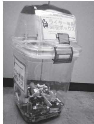
ライター専用回収ボックス

ぐために、各地域市民センターに、使用済みライター専用回収ボックスを設置しました。使い切れないライターは地域市民センターまでお持ちください。 また、この機会にごみカレンダーや「ごみ事典」をご覧ください、ごみの出し方を再度ご確認ください。