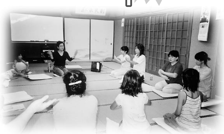
▲楽しい雰囲気の手話教室