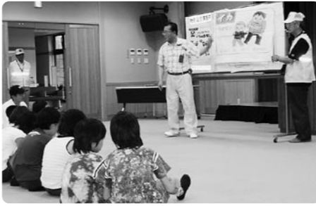
△「いかにのすし」で防犯対策

声をかけられても車にのらない。助けてとおお声で叫ぶ。110番の家にくすくす逃げる。危ないと思ったら大人にしらせる」ということを身をもって学びました。後半は、保護者向けに地域の子どものように守っていったらよいかの講演が行われました。希望ヶ丘地区安全安心まじりこり協議会では、子どもの安全を確保するために自主的に地域の防犯活動が行われています。