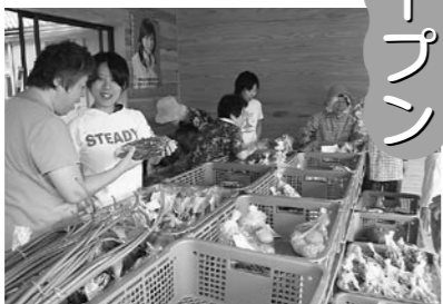
△大勢の人で賑わう岩室味菜市

安全・安心・新鮮をモットーとした味菜市は、野洲川の岩室橋近くのバス停「岩室の里」駅舎で毎週土曜日の午前8時から11時まで開店します。皆さんもぜひご来店ください。