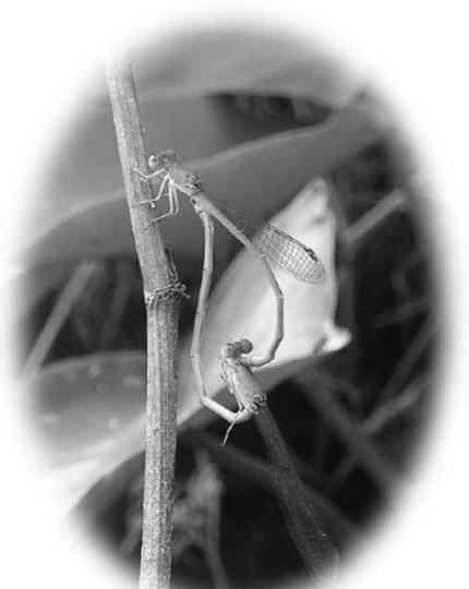
△発見されたベニイトトンボ

自然館では9月10日までの間、採取したベニイトトンボ1匹をはじめ、トンボの希少種の標本が展示されました。