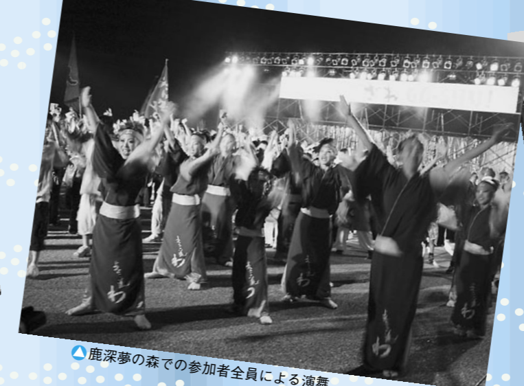
▲鹿深夢の森での参加者全員による演舞