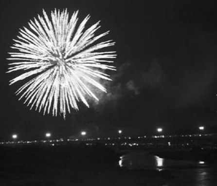
▼夏祭りの夜(左:水口夏まつりの花火 中央:甲南夏まつりの夢行灯 右:しがらき火まつりの松明奉納)