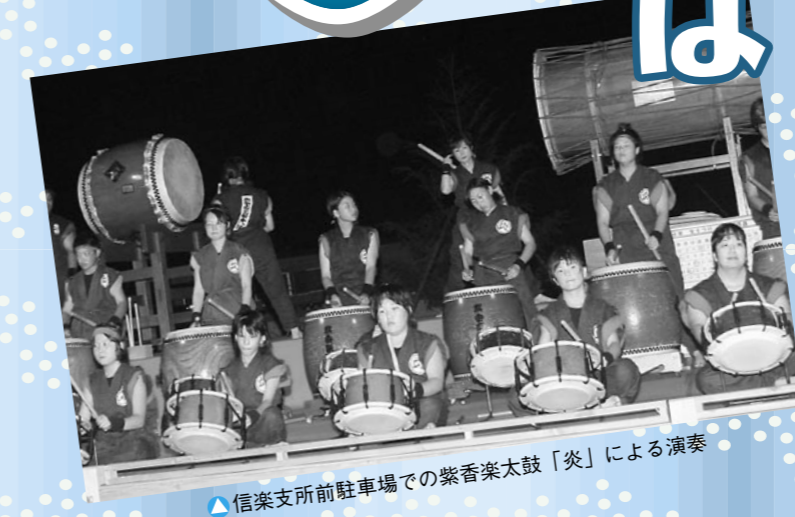
▲信楽支所前駐車場での紫香楽太鼓「炎」による演奏