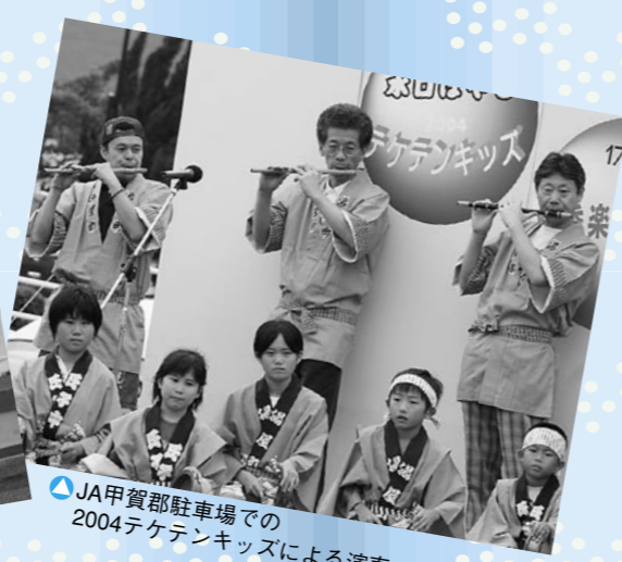
▲JA甲賀郡駐車場での2004テケテンキッズによる演奏