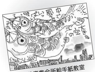
西教育集会所絵手紙教室