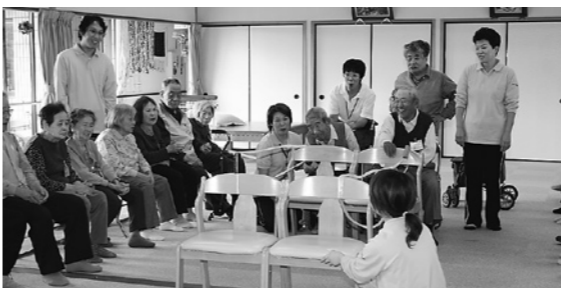
充実した老後を送るために