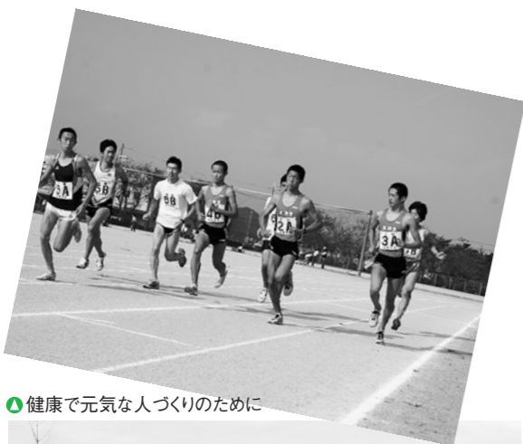
健康で元気な人づくりのために