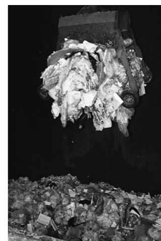
快適な生活環境づくりのために