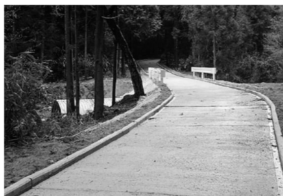
林業の活性化をすすめるために