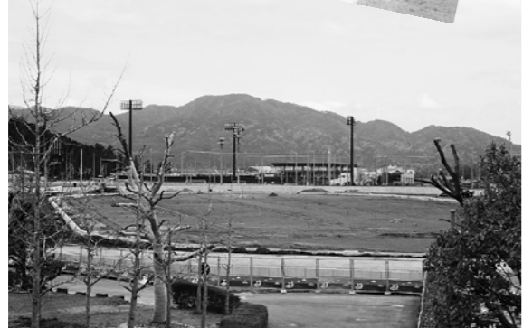
市民が集える体育施設の整備