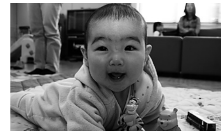
子どもたちの健やかな成長のために