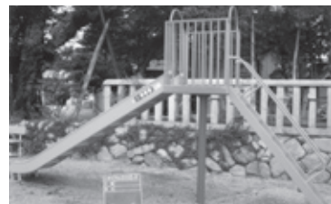
▲宇田区の公園遊具

この事業は、コミュニティの健全な発展を図るとともに宝くじの普及広報を目的とし、宝くじの一部を財源として助成されるものです。今回助成を受け、整備されたのは次の9地区です。