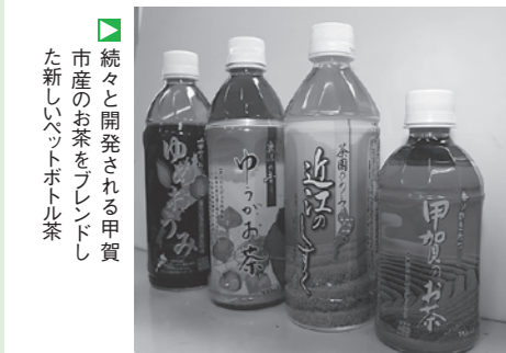
▲続々と開発される甲賀市産のお茶をブレンドした新しいペットボトル茶

八十八夜の5月2日頃には市内の茶畑で、農林大臣賞受賞をめざし品評会出品のための手摘みが始まります。市内の生産農家の中では日々お茶づくりの研究が行われ、関西茶品評会や全国茶品評会などでも常に上位に入賞していることから、今年の品評会にも期待が寄せられています。