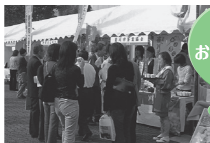
▲昨年の第60回全国お茶まつり (静岡県川根本町)

問い合わせ 大会事務局 (社)滋賀県茶業会議所 ☎ 63-6960 FAX 63-5204