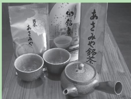
▲日本五大銘茶に数えられる朝宮茶

また、宇治茶(京都府)、川根・本山茶(静岡県)、狭山(埼玉県)などと並び日本五大銘茶のひとつに数えられています。