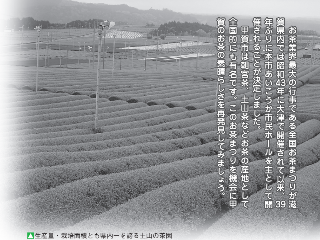
▲生産量・栽培面積とも県内一を誇る土山の茶園

お茶業界最大の行事である全国お茶まつりが滋賀県内では昭和43年に大津で開催されて以来、39年ぶりに本市あいこうが市民ホールを主として開催されることが決定しました。甲賀市は朝宮茶、土山茶などお茶の産地として全国的にも有名です。このお茶まつりを機会に甲賀のお茶の素晴らしさを再発見してみましょ。