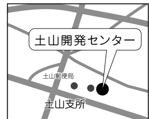
所在地：土山町北土山1715番地