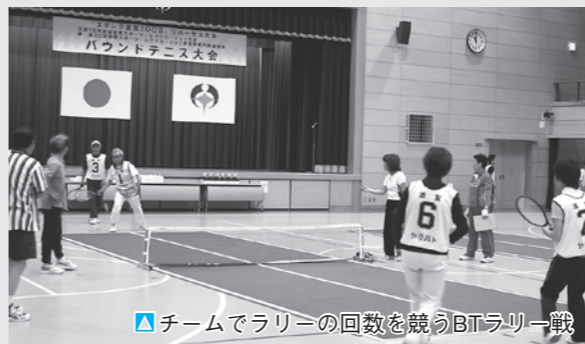
▲チームでラリーの回数を競うBTラリー戦

市内では、バウンドテニスとターゲット・バードゴルフの2種目が会場となります。6月10日(日)には、土山体育館で来年のリハーサル大会として滋賀県スポーツ・レクリエーション大会バウンドテニス競技が開催されました。