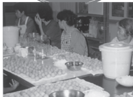
▲地域の皆さんで楽しく梅干づくりを行いました

また、こうした活動をきっかけに、地域の人の自らの考えや意見によるまちづくりが進められるよう期待しています。