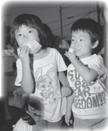
▶▶ 月見だんごを口一杯に頬張る子ども

当日は、コカリナやよし笛、ギター演奏のコンサートが開かれ、集まられた地域の方が心に響く調べに、訪れた文化の秋を満喫されました。また、この日は、月見だんごが無料で配られた他、松茸ごはんや月見うどんのコーナーもあり、皆さん食欲の秋も楽しめましたようです。