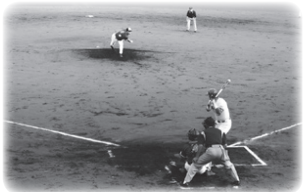
▲甲賀マスターズ(滋賀県)VS菊陽紳士クラブ(熊本県)の一戦

試合後の選手の疲労困ぱいの表情なかのすがすがしさからも、シニアのスポーツの魅力を感じることができた大会となりました。