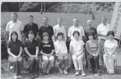
▲上朝宮製茶共同組合の皆さん

この組合は昭和43年に設立したもので、39年にもなります。今まで品評会には個人で出品していたのですが、今年品評会が滋賀県で開催されることもあり、共同で出品しました。出