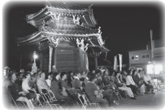
▶ コンサートで、コカリナなどが奏でる音に心癒される皆さん