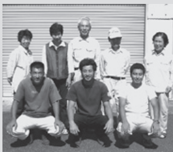
▲グリーンティ土山の皆さん

今は、もっと朝宮茶の歴史や魅力、朝宮茶ブランドをみんなに知ってもらいたいです。そういう意味でも今回の受賞はうれしく思っています。これからも朝宮茶の歴史を途切れさせないよう、これを励みに守り続けていきたいと思っています。