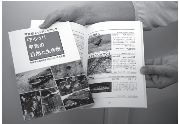
▲発行された甲賀市レッドデータブック

みなくち子どもの森自然館で1冊800円で販売します。郵送をご希望の場合は、お問い合わせください。