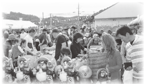
にぎわいを見せる信楽陶器まつり大陶器市

また、大陶器市の会場の食のコーナーでは、甲賀のもちのブースなども設けられ、信楽焼だけでなく、市内の特産品も販売されました。歴史と伝統を大切に守り続けられながら、多彩な陶器を創り出してきた信楽。信楽焼は、今後も生活文化への提案が期待されています。