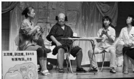
▲寸劇「ほのぼの家族の禁煙奮闘記」より

依頼があれば、地域の催しなどに出向き上演しますので、近くの健康推進員に気軽に声を掛けてください。連絡をお待ちしています。