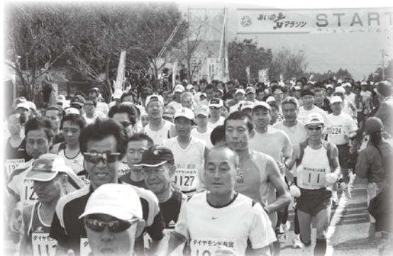
▲元気よくスタートする選手の皆さん