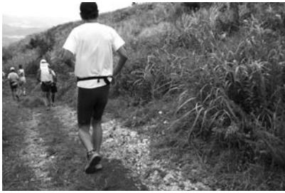
▲適度に休憩や歩きも入れながらハイキング感覚で