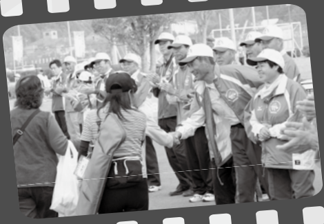
▲ボランティアや競技役員が笑顔で選手を見送り