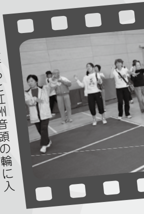
▲選手らと江州首頭の輪に入るマスコットキャラクター「ザッキー」