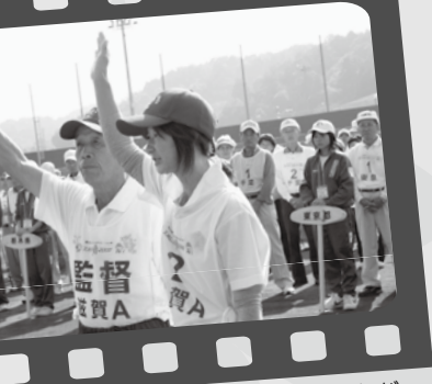
▲開始式では滋賀県チームが力強く選手宣誓