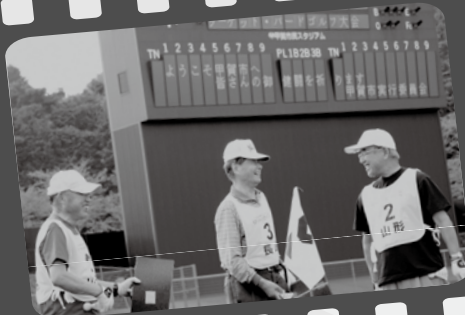
▲あちこちで見られた選手同士の交流