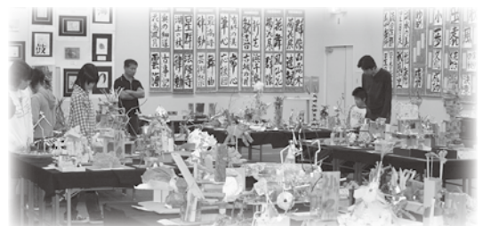
■子どもたちの作品が並んだ青少年美術展

訪れた家族連れは、自由な色使いで描いた絵画や、木の实や紙パックなどの廃材を利用した工作など、想像力あふれる力作に見入っていました。