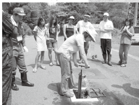
■住民が訓練に積極的に参加 (水口町桜ヶ丘区)

地震や風水害などの自然災害、尊い人の命 を脅かす犯罪などが増えるなか、安心して安全 な日常生活は誰もの願いであり、地域でもさ まざまな取り組みが行われています。