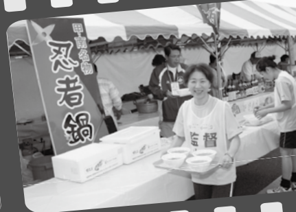
▲全国の選手に振る舞われた忍者鍋