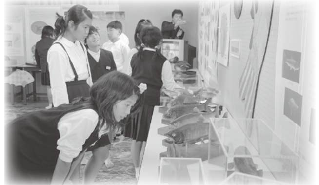
■ブラックバスのはく製に興味深く見学する児童

だけでなく、市内の他校の子どもたちや地域の皆さんにも親しまれる博物館をめざします。問い合わせは佐山小学校（TEL88-4077）まで。