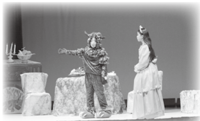
■全校9名によるオペレッタ「美女と野獣」

本番ではそれぞれの役になりきった児童らが、作品のテーマである「人を外見で判断しないこと、優しさや誠実さ、本当の幸せとは何か」を訴えかけるように熱演し、満席となった会場からは拍手が沸き起こりました。