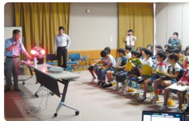
環境教育 地球温暖化について学ぶ

を越える自主サークル活動が展開されています。活動内容も、大正琴、舞踊、手芸、健康体操、カラオケ、ヨガ、囲碁、フォークダンスなど幅広く、子どもから高齢者までたくさんの方に利用されています。また、講座としては、「人権環境、一般教養、防災・防犯訓練」を柱として、さまざまな体験活動を行っています。