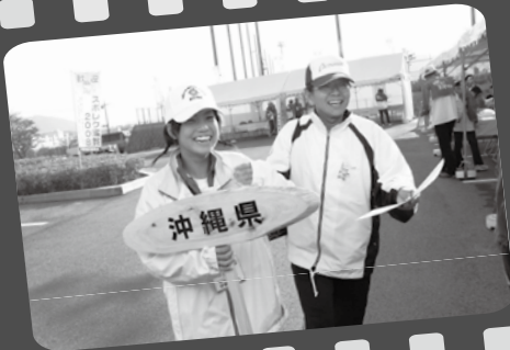
▲水口中生徒も競技補助員として活躍