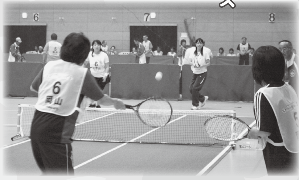
▲土山体育館で行われたバウンドテニス

バウンドテニスは土山体育館で行われました。開始式では、城山中学校吹奏楽部の演奏に合わせ、プラカードを持った土山小学校児童と選手が元気に入場行進しました。 209名の選手が競技に出場、2日目のB1ラウンド交流戦には土山中学校の生徒も参加し選手と親睦を深めました。 表彰式では、来年のスポーツ開催地である宮崎県の選手代表がマスコットキャラクター「ザッキー」のぬいぐるみを掲げ、全国の仲間に宮崎での再会を呼びかけました。