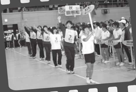
▲土山小児童が選手を先導して入場行進