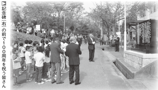
記念碑(右)の前で100周年を祝う皆さん

同校は、今後も子どもたちの笑い声と笑顔が絶えない学び舎として地域に愛され続けることでしょう。