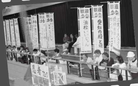
▲市内の小学生が描いたメッセージ入りのぼりが選手を応援