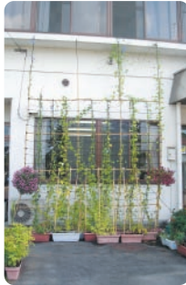
▶地域の皆さんと作った地球にやさしい緑のカーテン

日皆さんに見ていただき、育て方のアドバイスをもらったり「これ、まいたくで」と肥料をくださったたり…。おかげで、ツルが伸び過ぎて2階の窓以上の長さになり、とても驚きました。 これからも皆さんとアイデアを出し合い、新しい事にチャレンジしていきたいと思えます。職員の明るい笑顔を見に、どうぞ大野公民館にお越しください。