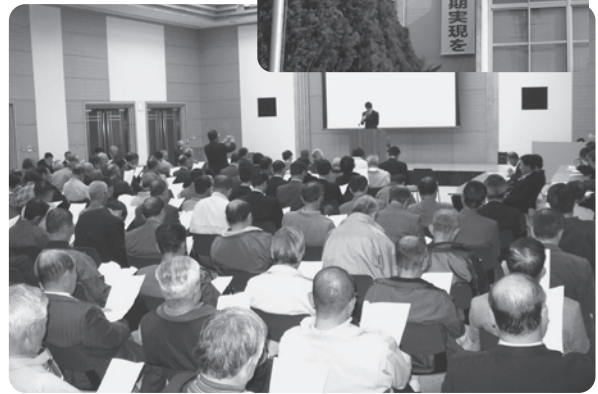
△盛大に開催された設立総会

新名神高速道路が夢と希望を乗せて、いよいよ開通します。それを南北に通る「名神名阪連絡道路」は、名神高速道路、新名神高速道路、名阪国道を連結し、広域な道路ネットワーク機能をつくり出す道路として、平成13年に地域高規格道路の調査区間に指定されましたが、目立った進展のないまま今日に至っています。