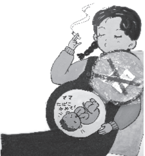
健康推進員作成 啓発用パネルより