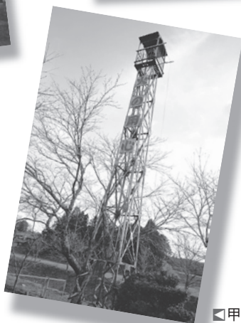
■甲賀町小佐治地先