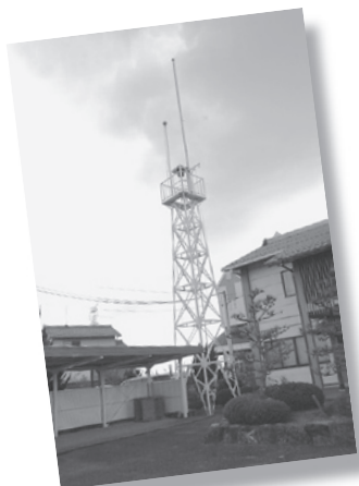
■水口町虫生野地先