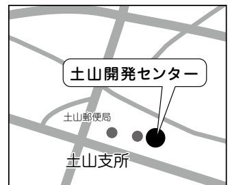
所在地：土山町北土山1715番地