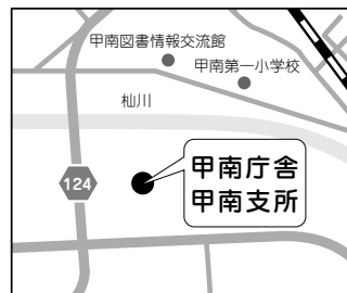
所在地：甲南町野田810番地