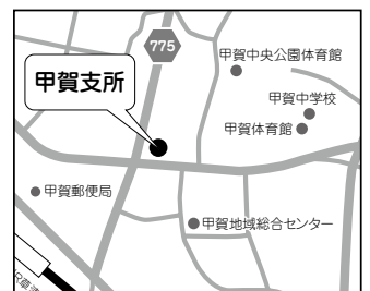
所在地：甲賀町相模173番地1