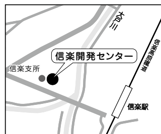
所在地：信楽町長野1203番地