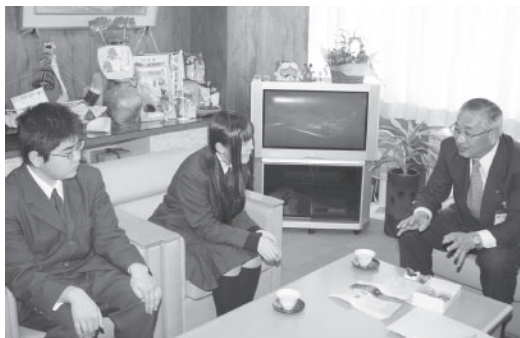
▲中嶋市長に和菓子開発の苦労話をする甲南高校生

緑豊（りくほう）かな甲賀（か）の地（ち）にちなんで「里山（さとやま）」と名付（な）けられたこの和菓子（わかし）は、4月（ごう）1日（にち）から甲南（かみな）地域の菓子店（かし）や新神（しんじん）の甲南（かみな）パーキングエリア（ぺあ）などでも販売（はんばい）されています。