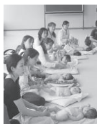
▲愛情いっぱいの子育てを

子育ては、多くの時間と手間をかけて子どもの成長を見守る大変なものですが、新たな喜びや楽しみをもたらしてくれるものでもあります。