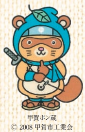
甲賀ボン蔵 © 2008 甲賀市工業会

マスコットキャラクターの「甲賀ボン蔵」は、信楽焼や甲賀流忍者にちなんで、忍者装束に身を包んだタヌキをイメージしています。