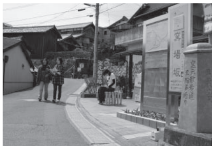
▲道路の陶板を道標に巡る窯元散策路