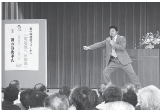
▶横綱との取組の様子を紹介する舞の海秀平さん

現役時代、小柄ながら多彩な技を繰り出し、体格の勝る相手を翻弄（ほんろう）し、人気を呼んだ舞の海さん。相撲界に入ったきっかけや、身長が足らず苦労した新弟子検査でのエピソードなど、自らの相撲人生を紹介し、「発想を変える