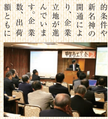
▲ 新春セミナーの様子

市内には、現在11の工業団地があり、近畿と中部の中間に位置する地理的条件や新名神の開通により、企業立地が進んでいきます。企業数、出荷額ともに