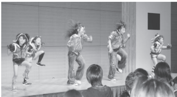
▲熱気あふれるダンスを披露する子どもたち

か ふか生涯学習館で3月22日、「まなび・たいけんフェスタ2009」が開催され、同館で活動するサークルや団体が1年間の学習の成果を発表しました。音楽や舞踊などのステージ発表や、書道・写真などの作品展示のほか、押し花や気功体操、木のパズルなどの体験コーナーも設けられました。また、星型のたこ作り会場では、青少年育成員（せいねんよせい）が作り方を指導しました。参加者は、アニメのキャラクターなど好きな絵を描いてオリジナルのたこを作成。親子で連たこにすることもでき、早速星の形のたこが大空に舞っていました。