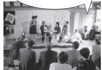
▲今郷地区老人クラブお楽しみ会(今郷公民館)

問い合わせ 健康推進連絡協議会事務局(保健介護課) ☎ 65-0703 ☎ 63-4085