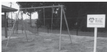
▲頓宮区に設置された遊具

問い合わせ 市民活動推進課 市民活動担当 ☎ 65-0687 ☎ 63-4554