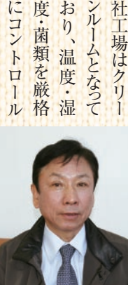
▲お話を伺った茂呂社長

当社では、最先端の医療用具・理学機器の設計から生産までを行っております。多くの研究機関と連携し、大学などの研究開発にも参加しています。弊社の特徴は、高精度で、耐久性に優れた金型を製作するとともに、加工の経験を生かして、革新的な製品を生み出す技術があることです。また、弊社工場はクリーンルームとなり、