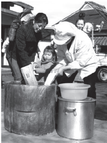
▲もちつきを体験する親子

育 育児ひろばアプリコットによるもちつき体験が1月27日、水口東部コミュニティセンターで行われました。アプリコットは幼児を遊ばせながら母親らがくつろげるサロン。もちつきで地域の人も交流しようとして事前にチラシを配布したところ、日ごろの利用者親子約30組のほか、近隣の人々が集まりました。もちやうす、きねが甲賀もちふる里館から運びこまれ、親子で一緒にきねを振り下ろ