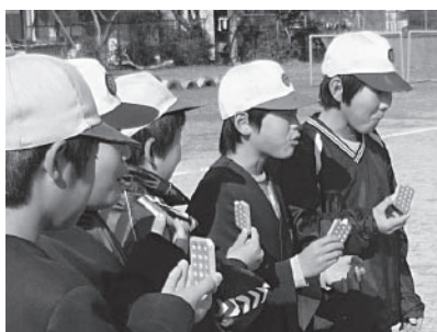
▲非常食の乾パンを試食

佐用町の集中豪雨や今年1月のハイチ共和国の大地震からは、常日ごろの訓練を中心に、日々の備えの重要性も知る機会になりました。当市では、万一の災害に備えて、職員訓練を実施しており、また、1月に入ってからからは地域や学校などでも訓練を行いました。