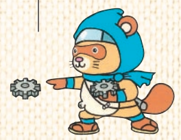
甲賀ギン藏 © 2008 甲賀市工業会

このコーナーでは、甲賀市工業会に加盟されている、ものづくり企業を紹介していきます。