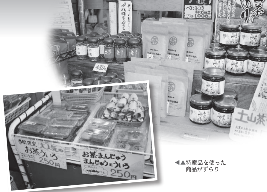
◀特産品を使った商品がずらり