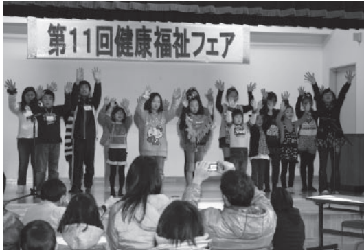
▲手話の歌を披露する子ども手話サークルのメンバー

また、子ども向けの催しも多彩で、学年ごとに回数を競うみんなでジャンプ（大縄跳び）や、人権カルタ大会に、小学生らの歓声が上がりました。