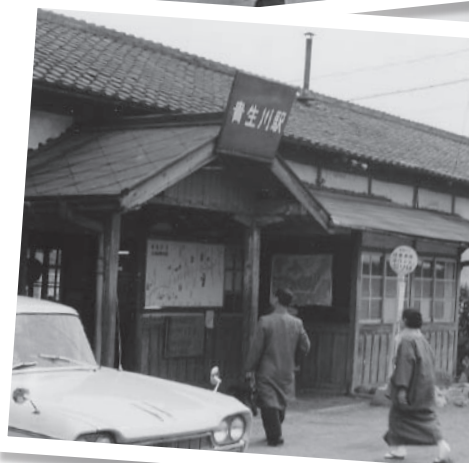
▲昭和41年頃の貴生川駅