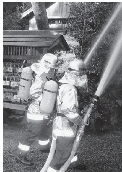
▲神山神社での消火活動

また、参加した住民は、信楽消防署員から消火栓の取り扱いについて説明を受け、真剣な表情で実地訓練に取り組みました。