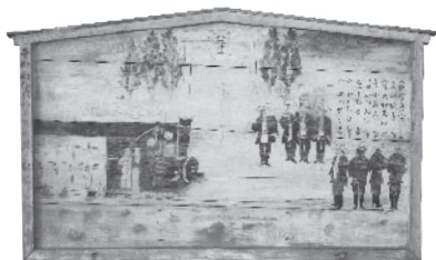
▲甲南・八坂神社に奉納されている鉄道絵馬

甲南駅(当時の深川駅)近くにある八坂神社(森尻)には、神社絵馬が残っています。これは鉄道開通の喜びを絵馬に託