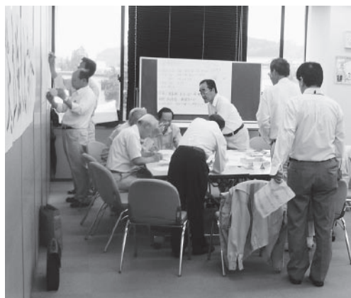
▲図上訓練を行う市職員

佐用町の集中豪雨や今年1月のハイチ共和国の大地震からは、常日ごろの訓練を中心に、日々の備えの重要性も知る機会になりました。当市では、万一の災害に備えて、職員訓練を実施しており、また、1月に入ってからからは地域や学校などでも訓練を行いました。