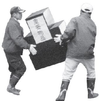
◀文化財を運び出す住民

予測もしない自然災害により甚大な被害を受ける日本。15年前には阪神・淡路大震災が発生、多くの尊い命が奪われるなど、自然災害の猛威を改めて思い知らされることとなりました。 日本各地では、これを教訓に、災害に強いまちづくりが進められています。昨年8月に発生した兵庫県