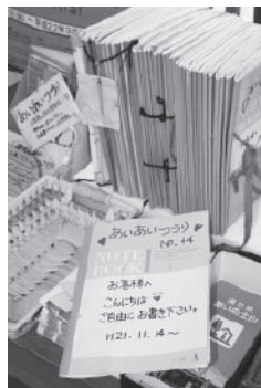
▲コメント一つひとつに駅長の返事が書かれる「あいあいつづり」

り、おいしいうどん・そばを提供しています。なかでも、土山茶を使った茶うどんや、田村川の清流で育ったあまごの甘露煮をのせたそばは、ここにしかない人気の品です。また、やまなみ館では地元の方が丹精込めて作ってくださった野菜なども販売しています。 皆さんとの出会いを大切に、心を込めてお迎えます。ここにしかない商品を取りそろえてお待ちしておりますので、市内の皆さんもぜひお立ち寄りください。