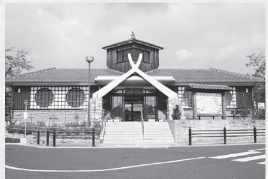
▲巻物を持った忍者をイメージした油日駅

を訪れる観光客や登山客も多く、道案内も大切な仕事。行き届いた説明ができるのも地元を知り尽くした駅員さんならではのです。