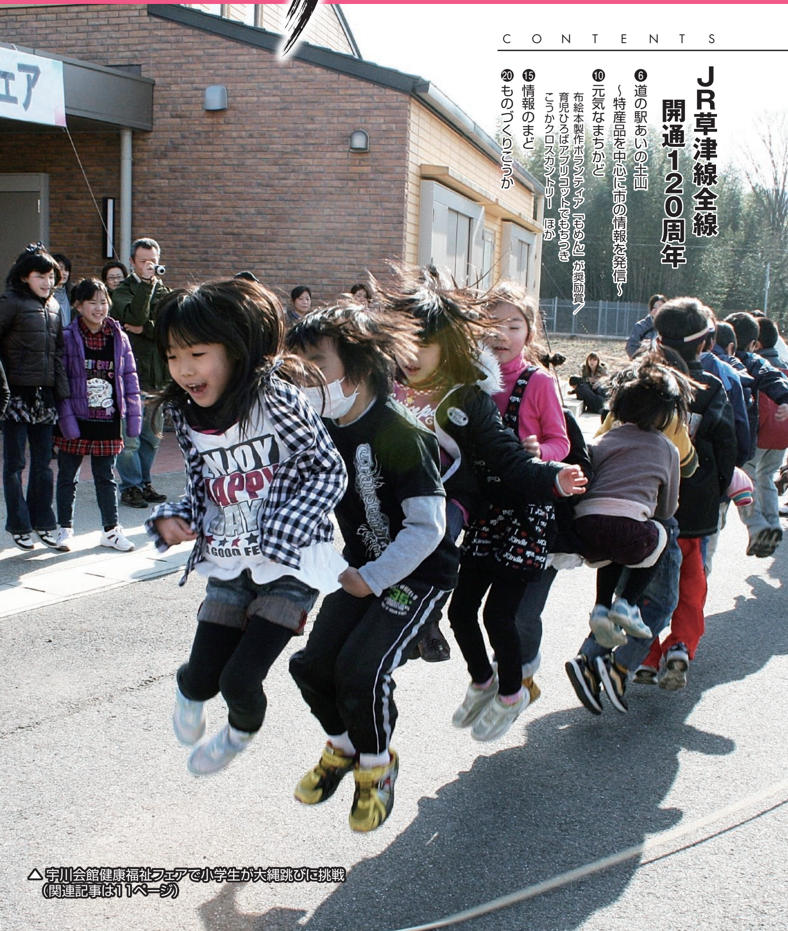
△ 宇川会館健康福祉フェアで小学生が大縄跳びに挑戦 (関連記事は11ページ)