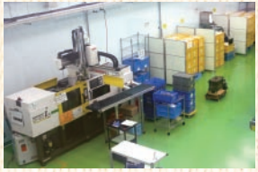
▲温度・湿度が一定に保たれているクリーンルーム

設立・平成3年3月 従業員数・84名 所在地・甲南町柑子2002番地19 TEL・06-8615 FAX・06-8616