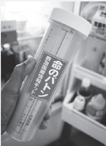
▶配布される救急医療情報キット(命のボタン)

なお、キットなどに貼られているステッカーは、信楽中学校の生徒がデザインするなど、地域あがての取り組みが進められました。