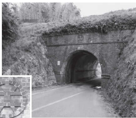
▲上部に関西鉄道の社紋が見られる国分橋梁

三雲駅から甲南駅間には、装飾的なデザインが施されたれんがのアーチ橋が3つ見られます。なかでも、水口町高山地先にある国分橋梁には、草津線を敷設した関西鉄道会社の社紋が入っています。