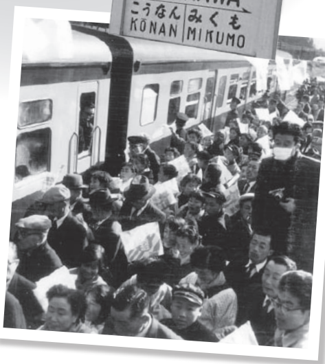
▲駅が開業した昭和34年ごろ、人であふれる寺庄駅ホーム