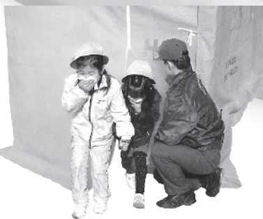
▲煙ハウスで煙の怖さを体験

油日小学校では1月18日、午前10時に地震が発生したと仮定して避難訓練が行われました。運動場に集合した児童は、市防災担当から火や消火器の取り扱い方法などを聞いた後、煙体験をしました。真っ白な煙が立ち込めるハウスの中を、ハンカチで口を押さえながら身をかがめて通り抜けていました。