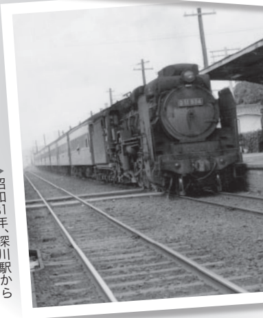
▲昭和31年、深川駅から改称されたこの甲南駅

を支えた日本の大動脈、東海道。草津線は当時の宿場があったまちを縫うように走っています。