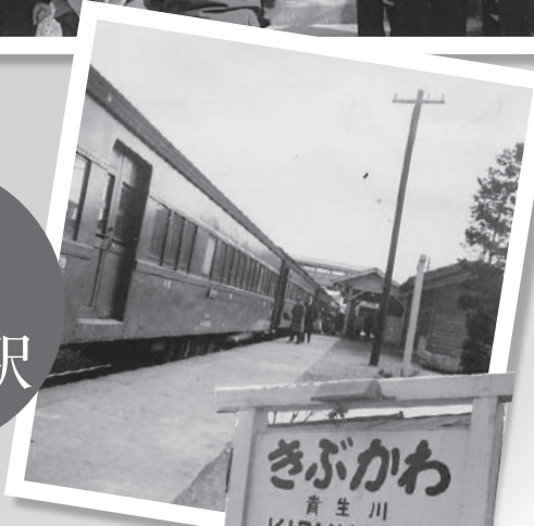
▲昭和30年代の貴生川駅