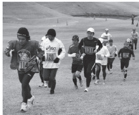
▲起伏に富んだコースを駆け抜ける参加者

ゴ ルフ場を走り抜ける、こうかクロスカントリーが1月31日、富士スタジアムゴルフ倶楽部北コースで開催され、市内をはじめ京都・大阪などから62名が参加しました。市体育協会甲賀支部と甲賀創健文化振興事業団が主催し今年で8回目。ゴルフ場に設定された高低差のあるコースで、男女別に10,000mと5,000mの部に分けて行われました。あいにく小雨の降る空模様となりましたが、ランナーは自然