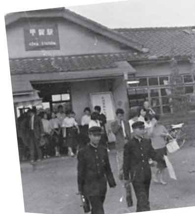
▼昭和30年代後半～40年代の甲賀駅

現在の草津線は、JR東海道本線と接続する草津駅(草津市)から関西本線の柘植駅(三重県伊賀市)を結ぶ36.7キロのJR西日本の鉄道路線です。明治22年(1889年)に東海道線の全線開通とともに当時の鉄道会社である関西鉄道会社により、まず草津―三雲間が開通し、翌明治23年(1890年)、三雲―柘植間が延伸開業し全線開通となりました。また、昭和55年(1980年)には全線が電化されました。