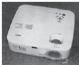
▲柏貴区の液晶プロジェクター

◎柏貴区 210万円 デジタル複合機、ノートパソコン、液晶プロジェクター、テント、エアコン 等