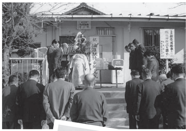
▼昭和51年の油日駅待合所完成式

市内を駆け抜けるJR草津線。その車窓からは、豊かな自然や田園風景、鈴鹿の山並みなど四季折々の景色は、であい・こころが八景の一つにも選定されています。 時代とともに、蒸気機関車からディーゼル車そして電車へと姿を変えながら、多くの人・モノ・情報を乗せて走り続け、2月19日には、全線開通120周年を、また3月3日には全線電化から30周年を迎えます。 この間、列車の増発や速度アップ、駅周辺整備などにより、安全性や快適性が高められ、私たちの暮らしを支える重要な役割を果たしてきました。 公共交通の要として、甲賀地域の発展を支えてきた草津線。今月号では、草津線の歴史や駅を守る住民の取り組みについてご紹介します。