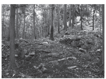
▲黒川氏城 (土山町鮎河)

いった一般的な城のイメージにはほど遠い城ですが、戦国時代の城郭のひとつの典型であり、それが密集する様子は、土豪・地侍、つまり今日「甲賀武士」と呼ばれる人々の地域管理のありかたを色濃く反映したものと考えられています。つまり甲賀の城は甲賀の歴史を語る大切な証人なのです。どうぞご期待ください。