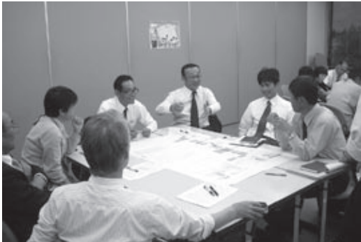
▲研修で地域の課題を考える市管理職級職員

この研修を通して、今後は管理職級職員が一般職員の理解度を深める指導を行うとともに、地域に入って市民の皆さんとともに課題を共有し、（仮称）自治振興会の設立に向けて一緒に汗を流していきます。