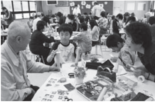
▲一緒に万華鏡を作る児童と祖父母ら

周りの人たちと完成した万華鏡をのどき合いいし、あちこちで「わあ、きれい」という声が上がっていました。