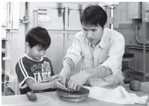
▲親子がふれあい楽しく陶器作り

甲 南ふれあいの館で5月15日、ふれあい親子陶芸教室が行われました。 この日は、事前に応募のあった家族連れ17名が参加、ボランティアの方の指導を受けながら、家族一緒に粘土を積み重ねたり、伸ばしたり、模様を付けたりしながら、「ご飯茶碗や皿、花瓶など、思い思いの作品を作りました。」 出来上がった作品は、ボランティアの方により、焼き上げが行われます。参加の皆さんは、家族で作ったオリジナル作品を、お家で使うのが待ち遠しい様子でした。