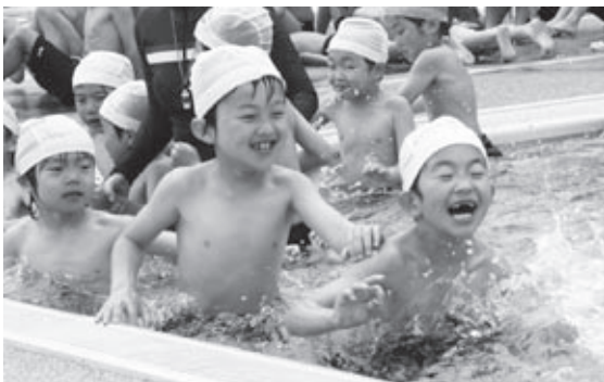
▲歓声をあげながら初泳ぎを楽しむ子どもたち

6 月に入り、市内の各小学校でプール開きが行われ、プール学習がスタートしました。 2日に行われた土山小学校のプール開きでは、プールサイドに集合した全校児童に、校長先生が「これから約2か月間、目標をもって取り組んでください」と励ましのあいさつ。各学年の代表児童がそれぞれの目あてを発表した後、6年生による模範水泳が行われました。 この日は気温が上がり、プール日和となりましたが、それでも今年初めてのプールに、「冷たい」と第一声を上げた子どもたち。潜ったりしぶきをかけ合ったりしながら、久しぶりの水の感触を全身で楽しんでいました。