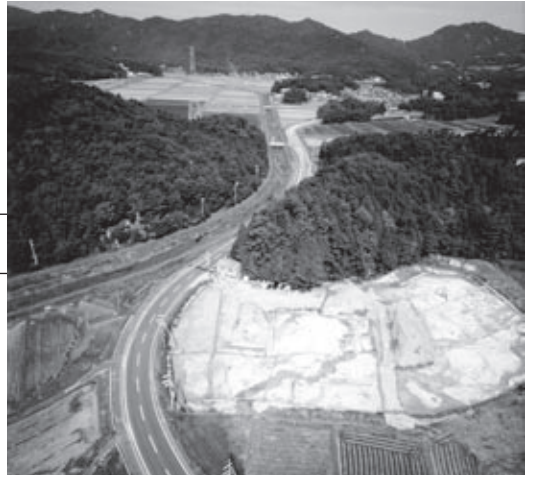
▲新宮神社遺跡調査地全景

紫香楽宮の宮殿と大仏造りが進められたと見られる甲賀寺を結ぶ道路跡と、3棟の役所建物などが発見されました。道路の幅は約12メートルで、当時の国道クラスの立派な道が、紫香楽宮に整備されていたことが明らかになりました。 (指定面積 19,982.02㎡)