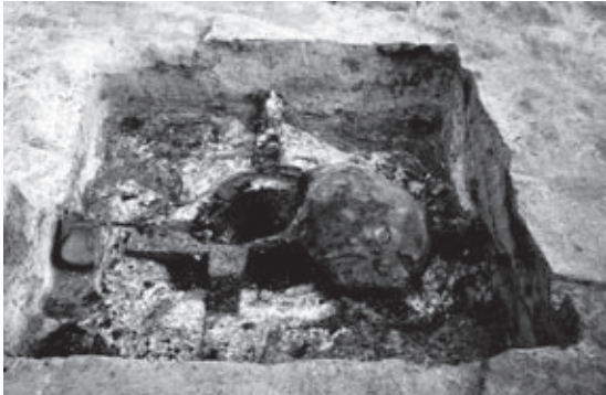
▲ 鑄造遺構が見つかった鍛冶屋敷遺跡