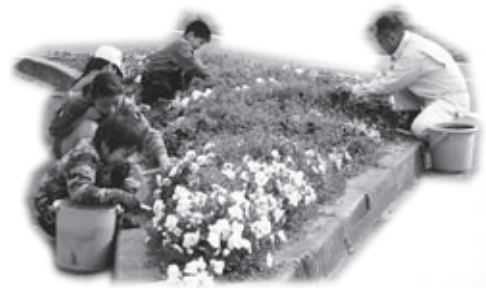
▲地域の人と一緒に世話をする地区花壇

年秋の植え付け後、園芸ボランティア委員会を中心に世話を続け、2回の審査時に花が最高の状態になるように気を配りながら栽培した結果、「花壇の広さや花の出来が他とは違う」と審査員にも絶賛されたそうです。 一人一鉢栽培をはじめ、地域の人たちと一緒に世話をする地区花壇活動、一人暮らしのお年寄りや地域の保育園や幼稚園への花のプレゼントなど、日頃からの児童たちの花への関わりも評価されての大賞受賞。次も大賞をめざし、すでに秋花壇に向けての作業が始まっています。