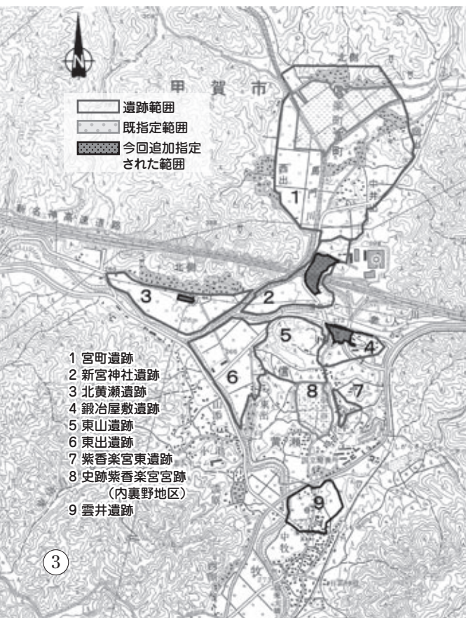
◀紫香楽宮関連遺跡の分布地図と史跡指定範囲

新宮神社遺跡の道路跡から約900メートル西側で、1.8メートル四方の井戸とその覆屋が発見されました。井戸は、平城宮の造酒司(酒造部署)や大膳職(調理部署)の井戸に匹敵する規模と構造を備えており、そういった役所が紫香楽宮に存在していたことが明らかになりました。また、井戸を構成する部材の年輪調査では、まさに宮が造営されていた天平16年に伐採された木材であることも判明しました。 (指定面積 2,888.00㎡)