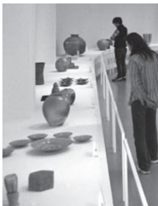
▲信楽伝統産業会館での展示

次に、商店街の空き店舗では、2つの企画展示を計画しています。1つは、陶歴が10年以内の若手陶芸家による展示で、作家同士の新たな交流の場づくりとします。もう1つは、光源にLED電球を使用した「灯り」がテーマの作品展示です。信楽窯業技術試験場で開発された「信楽透器」として話題となった透光性のある陶土を活用した作品です。