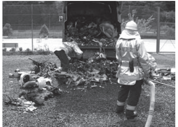
▲ライターによると思われるごみ収集車の火災