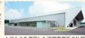
▲アルミを使用した滋賀事業所の社屋

き、環境面でも貢献する素材です。お客様のニーズをお聞きしながら、アルミの持つ可能性とメリットを提案し、世界を舞台に活躍するアルミのトータルクリエーターをめざします。