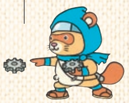
甲賀ボン蔵 © 2008 甲賀市工業会

このコーナーでは、甲賀市工業会に加盟されている、ものづくり企業を紹介していきます。