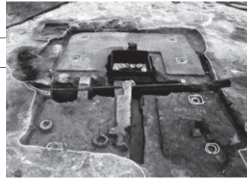
▼北黄瀬遺跡から出土した井戸遺構

甲賀寺跡から400メートルほどの近い場所で、銅製品を大量に生産した大規模な工房跡と、その西側近くで2棟の役所建物が発見されました。工房では大型の仏像台座や梵鐘が鑄造され、寺院造営に必要な大量の銅製品が集中的に生産されていたことが明らかになりました。 (指定面積 13,501.26㎡)