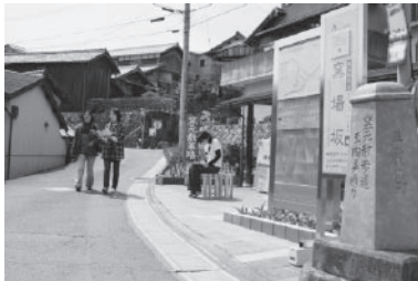
▲まちなか散策 (昨年度のイベントより)

まちなか散策では、窯元・工場の蓄積された技や製作現場の日常風景を、「見せる・伝える」ことや、窯元散策路かいわいの倉庫などの資源を活用し、一味違った空間展示を行い、幅広く“信楽ファン”の獲得をめざします。