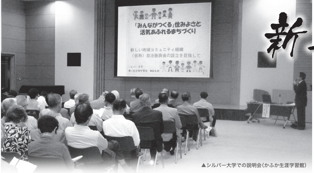
▲シルバー大学での説明会(かふか生涯学習館)