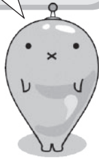
ウォーターステーション イメージキャラクター 「しずくくん」

琵琶湖およびその周辺において、住民と住民、ならびに住民と行政との連携・協働を行う人です。