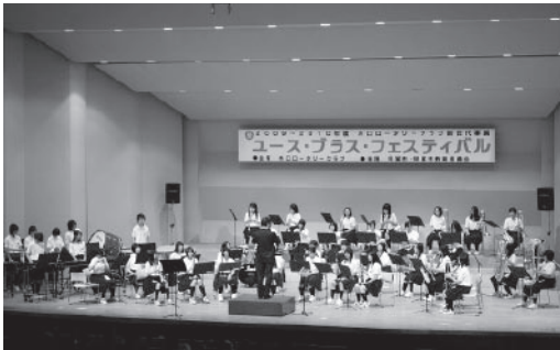
▲演奏を披露する吹奏楽部の皆さん

市 内6中学校の吹奏楽部が一同に会し、発表する「ユース・ブラス・フェスティバル」が6月5日、あいこつが市民ホールで行われました。 この演奏会は、音楽を通じて交流を深めることを目的に、水口ロータリークラブ主催で初めて行われたもの。当日は席に座りきれないほどの大勢の方が会場を訪れ、生徒の演奏を楽しみました。 各中学校からは、クラシックやポップスのおなじみの曲を披露、日ごろの練習の成果を発揮すると、会場からは惜しみない拍手が贈られました。