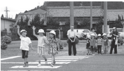
▲コース内で道路を渡る練習をする児童

また、この日は白バイも登場、周近で見る格好良い白バイに児童は大喜び、警察の方にいろんな質問をしていました。 最後に一人ずつ白バイに乗せてもらって記念撮影、楽しい教室で児童は交通ルールをしっかり学び、学ぶことができました。