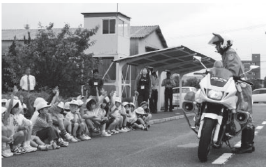
▲白バイの説明を聞く児童