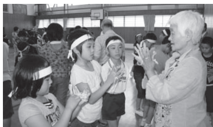
▲あやとりを教わる児童

この日は、1950年に同校を卒業された同窓生のうち、13名の方が来校、当時の遊びを紹介し、全校児童が学びました。 児童は、紙鉄砲やこま回し、メンコやあやとりなど、子どもたちにとっては少々珍しい遊びを体験、卒業生の皆さんからコツを教わり、楽しく遊ぶことができました。 また、卒業生の皆さんが制作された、当時の写真を使った紙芝居では、60年前の同校の様子などを紹介、貴重な話を聞くことができました。