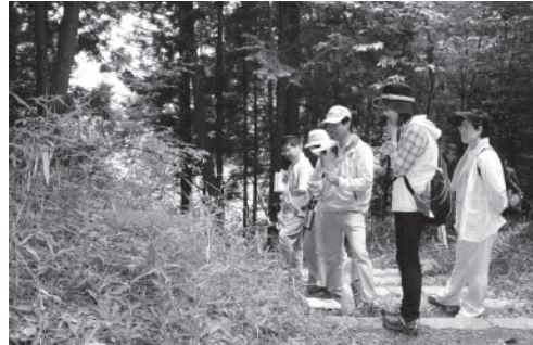
▲ササユリを観察する皆さん

織 細な姿形と甘い香りが魅力の市の花ササユリ。市内では地元の方が熱心に保護活動されていることもあり、その姿を見ることができませんが、栽培が困難なため、全国的に希少な花となりつつあります。 そんなササユリをもっと知るため、6月6日、みなくち子どもの森で、自生するササユリを鑑賞しながら学が「ササユリ守り隊」が行われました。 この日は、野草の愛好家や家族連れの方が集まり、子どもの森内の自然の観察や、ササユリの特性などについて学びました。 この日、同森のササユリはまだ咲いていませんでしたが、大きなつぼみをつけていることが確認でき、約1週間後にかれんに花を咲かせました。