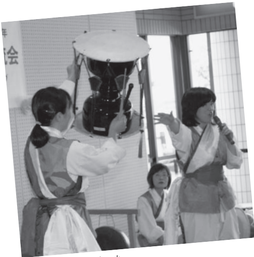
▲楽器の説明コーナーも

サムルノリとはこのような意味があるそう、その昔豊作を祈って始められたのがルーツだそ