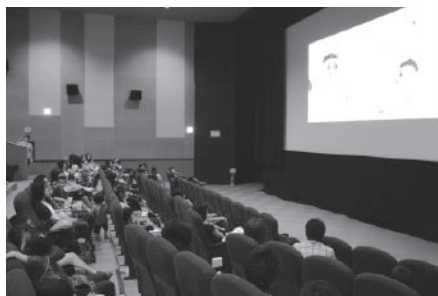
▲スクリーンの絵本に見入る参加者の皆さん

この日は、小さなお子さん連れの親子ら100名が参加、子どもたちはスクリーンに映し出される大迫力の絵本にびっくり。おもしろおかしい朗読に歓声を上げながら、絵本ワールドに引き込まれました。