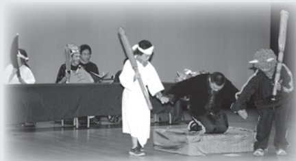
▲劇団ふりいだむによる「杜子春」