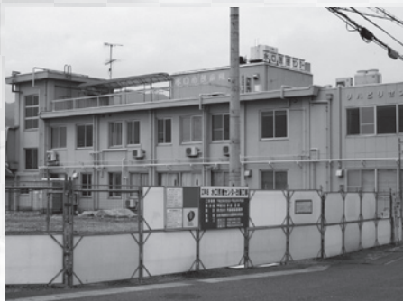
▲工事が始まった診療所棟