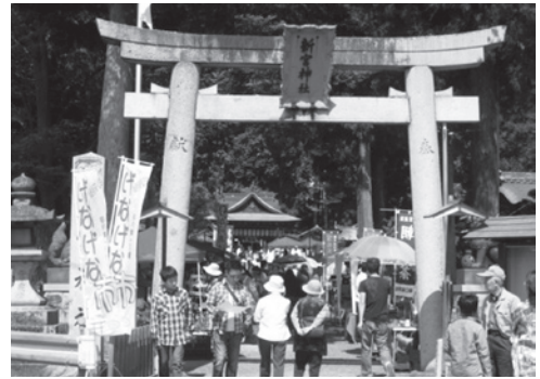
▲毎月開催されるげなげな市