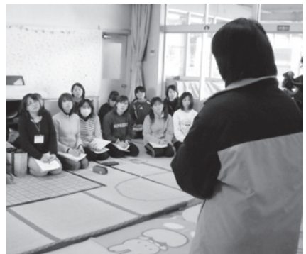
▲保育園での合同研修

私たちの活動に興味を持たれた方、またお近くに盲ろう者がおられましたらお誘いいただき、お気軽にお越しください。